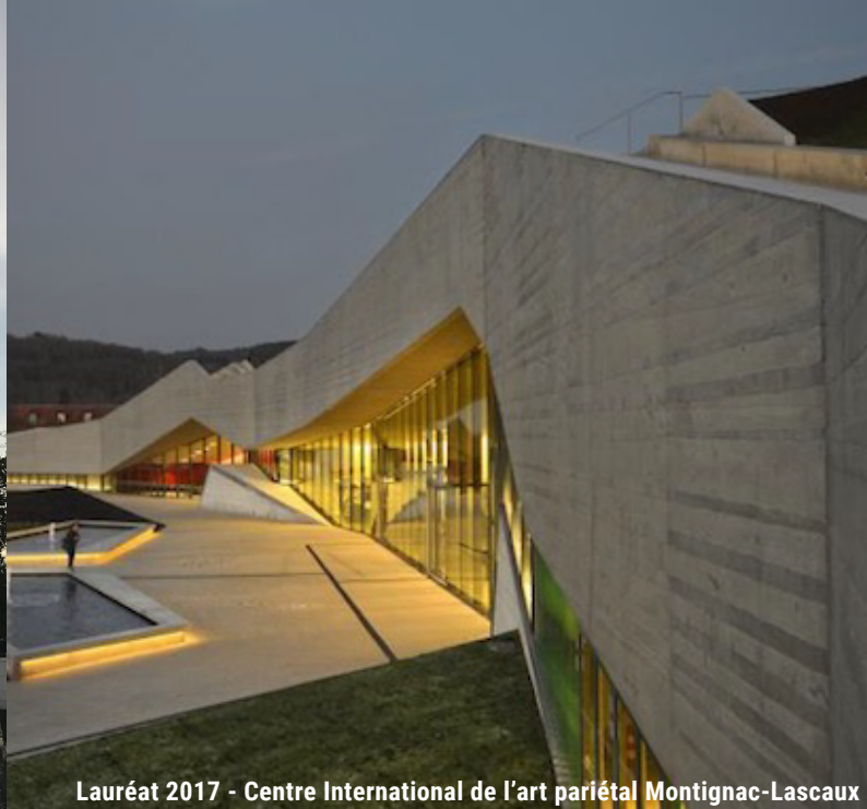
Lauréat 2017 - Centre International de l'art pariétal Montignac-Lascaux