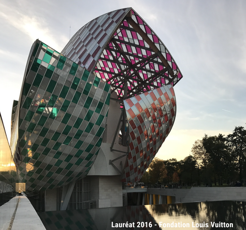
Lauréat 2016 - Fondation Louis Vuitton