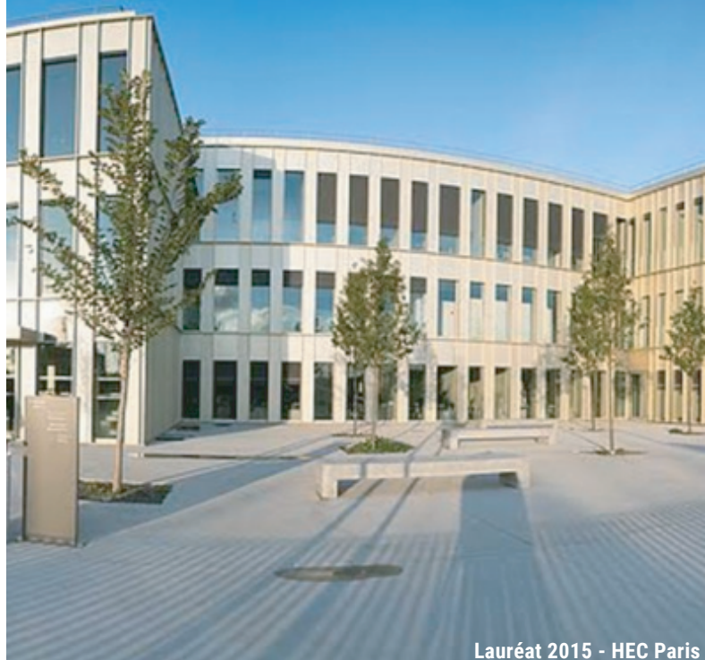
Lauréat 2015 - HEC Paris

Créé par la Fédération Française des Métiers de l'Incendie, qui fédère 12 groupements de la prévention et de la protection contre l'incendie, l'Oscar de la FFMI a pour volonté de récompenser une entreprise, un site ou une équipe qui a mis en place et développé une stratégie particulièrement exemplaire au plan de la sécurité incendie.